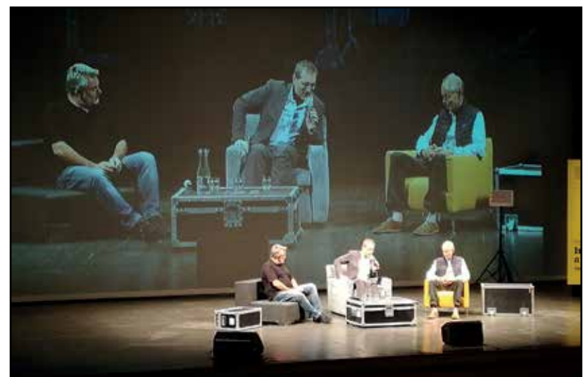
I relatori del Convegno.

Le riprese sono state eseguite sulla nave di Medici Senza Frontiere, la Vos Prudence, popolata da dottori con lo spirito dei volontari, ma con la massima esperienza possibile. Li si vede all'opera in tutte le situazioni critiche che un salvataggio in mare può comportare: devono curare ustioni, donne incinte, bambini malnu-