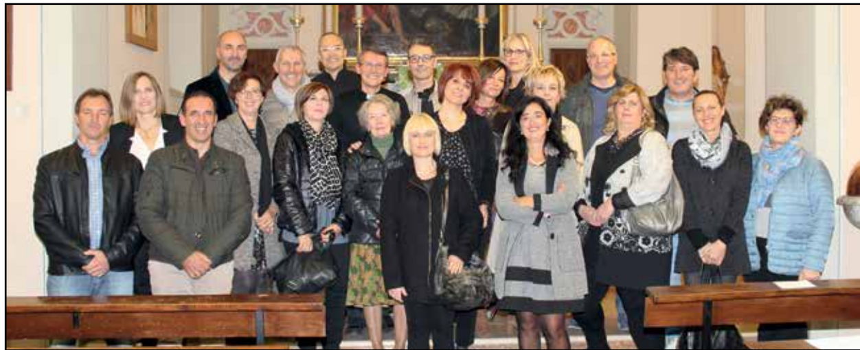
Ricordo della festa del cinquantesimo nella Chiesa di S. Giovanni Battista a Vighizzolo.