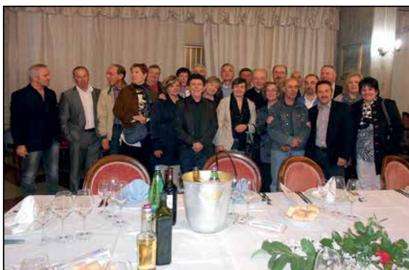
L'incontro dell'ultima festa.

Quindi affrettateVi ad iscriverVi, entro e non oltre il 10 Novembre, versando la Ca-